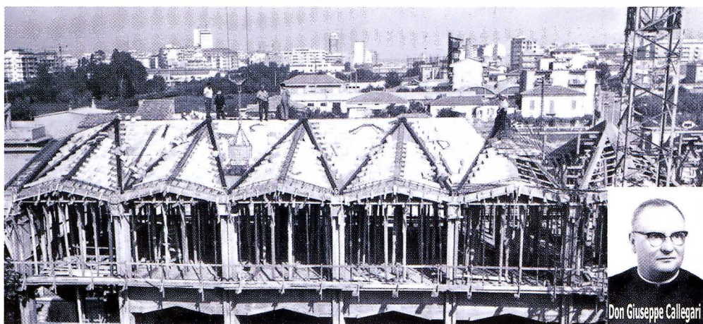
Anni 70 : i lavori per il nuovo complesso Don Orione ( sullo sfondo uno scorcio del panorama di Pescara)