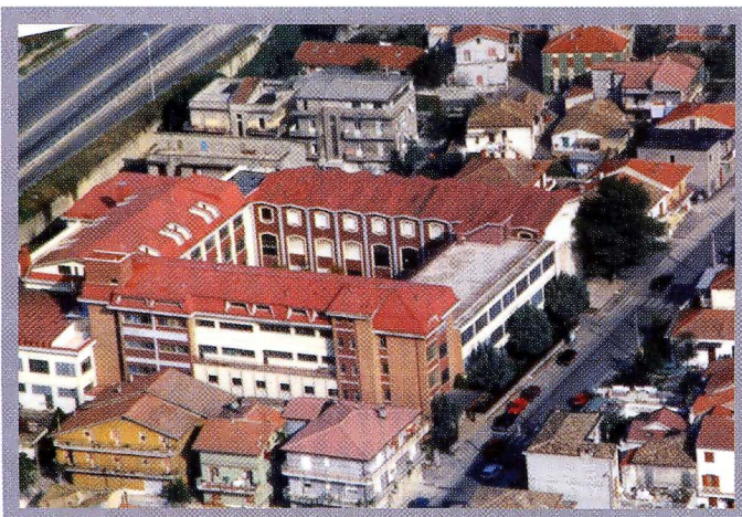
Fotografia aerea dell'Istituto Don Orione