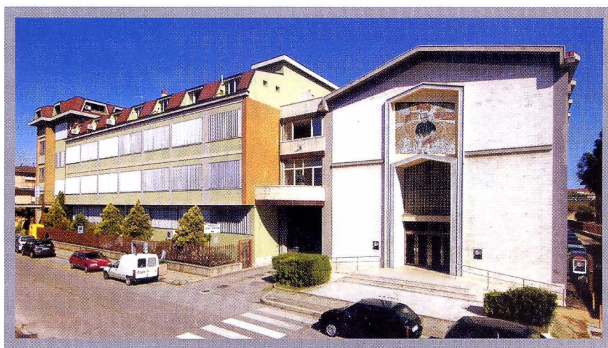
Via Aterno- ingresso e facciata anteriore con a fianco la Chiesa dedicata alla Madonna Dell'Assunta