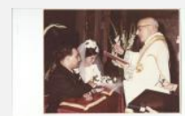
Benedicendo un matrimonio